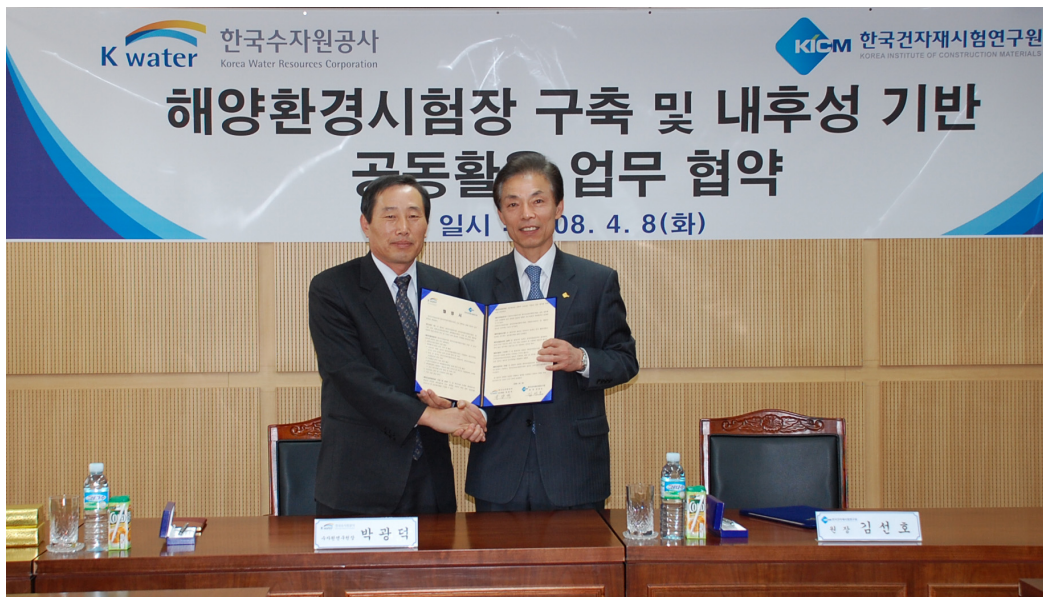
< 협 약 식 사 진 >